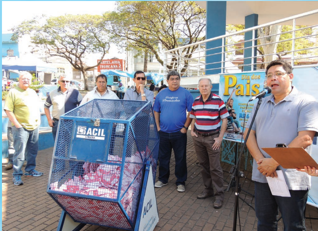
O sorteio do Dia dos Pais foi realizado na Praça Toledo Barros, no dia 26 de agosto