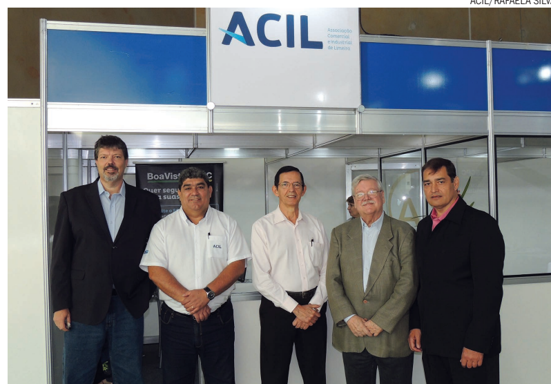
A ACIL também esteve presente na ALJOIAS com seu estande e serviço gratuito de consulta de crédito, através do departamento de SCPC

realizada uma Cerimônia de Homenagem ao Deputado Federal Miguel Lombardi, autor da Lei que reconhece Limeira como Capital Nacional da Joia Folheada, contando com a presença de autoridades locais e regionais, além dos representantes das entidades de limeirenses que abrilhantaram e enriqueceram a cerimônia.