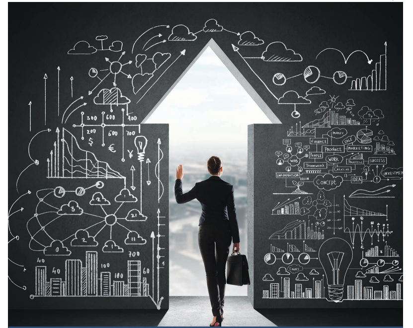
Limeira é uma cidade pujante e possui grandes empreendedores que contribuem com seu desenvolvimento